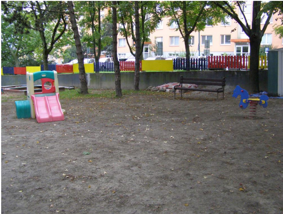
Po ukončení 1. etapy, október 2014